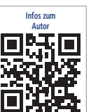
Infos zum Autor

MediKom Consulting GmbH Obere Bergstraße 35 90607 Rückersdorf Deutschland Tel.: +49 911 99087030 w.apel@medikom.org www.medikom.org Podcast: unternehmenarztpraxis.podigee.io